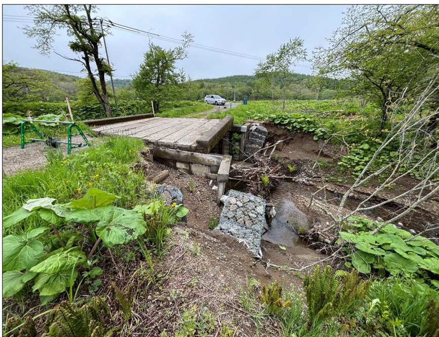
馬主来大秋線界橋災害復旧工事