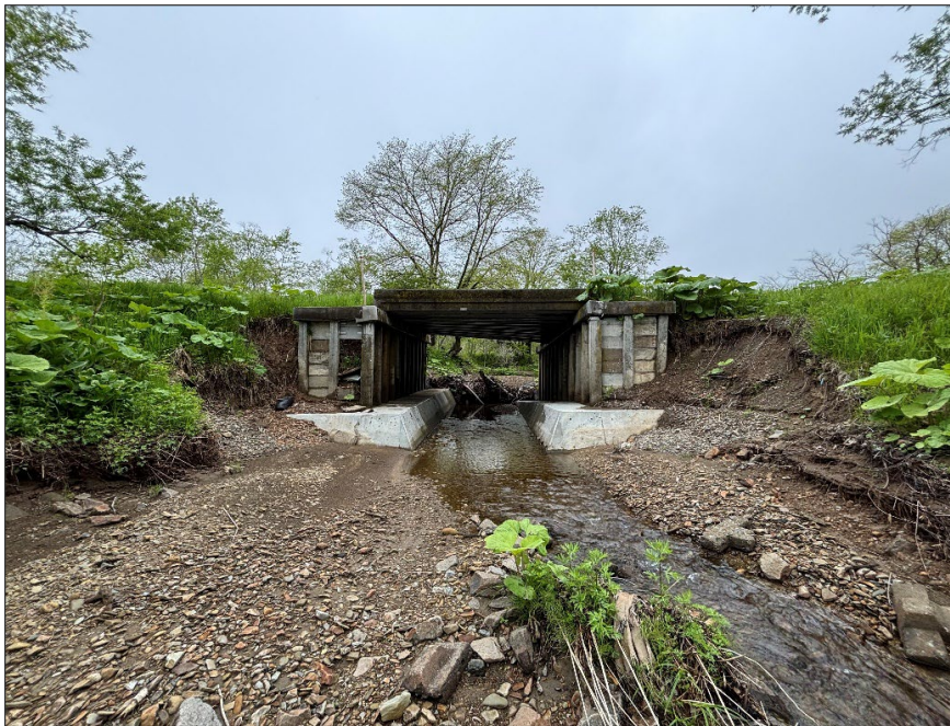
馬主来大秋線界橋災害復旧工事