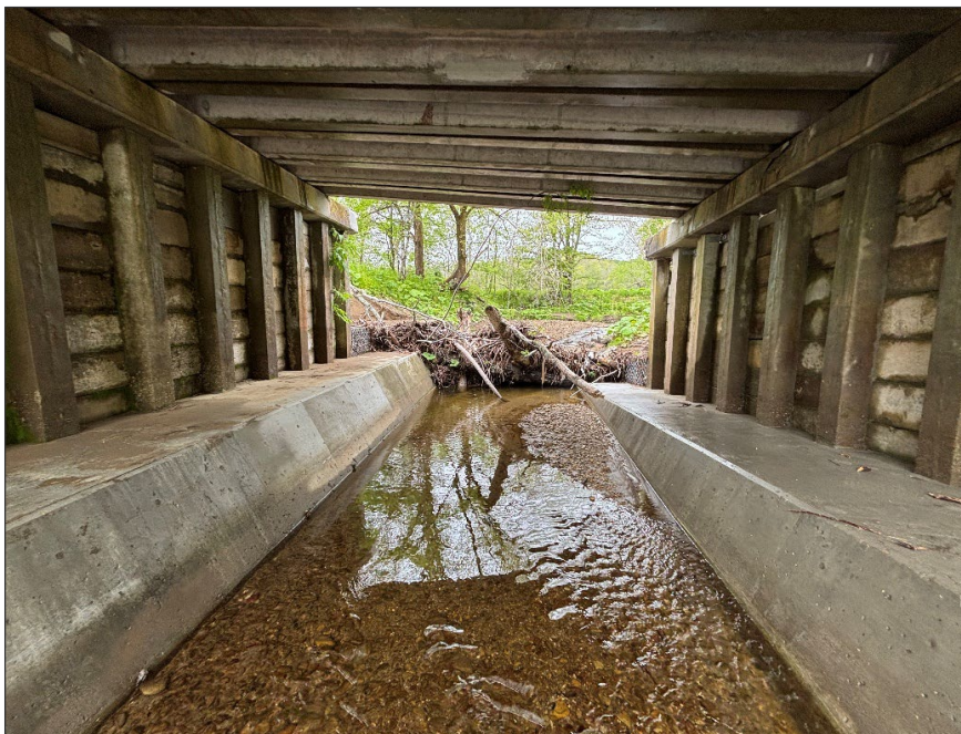
馬主来大秋線界橋災害復旧工事