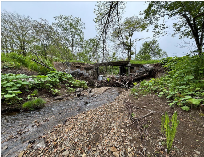
馬主来大秋線界橋災害復旧工事