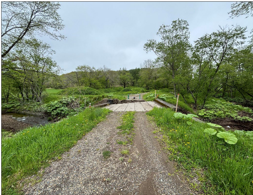
馬主来大秋線界橋災害復旧工事