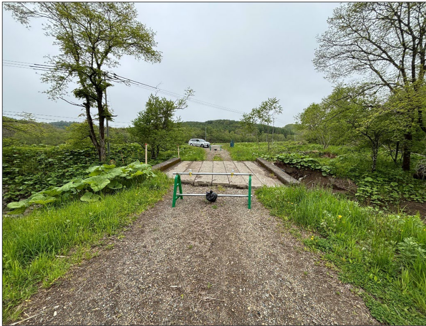
馬主来大秋線界橋災害復旧工事