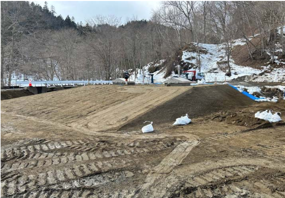
盛土法面整形完了