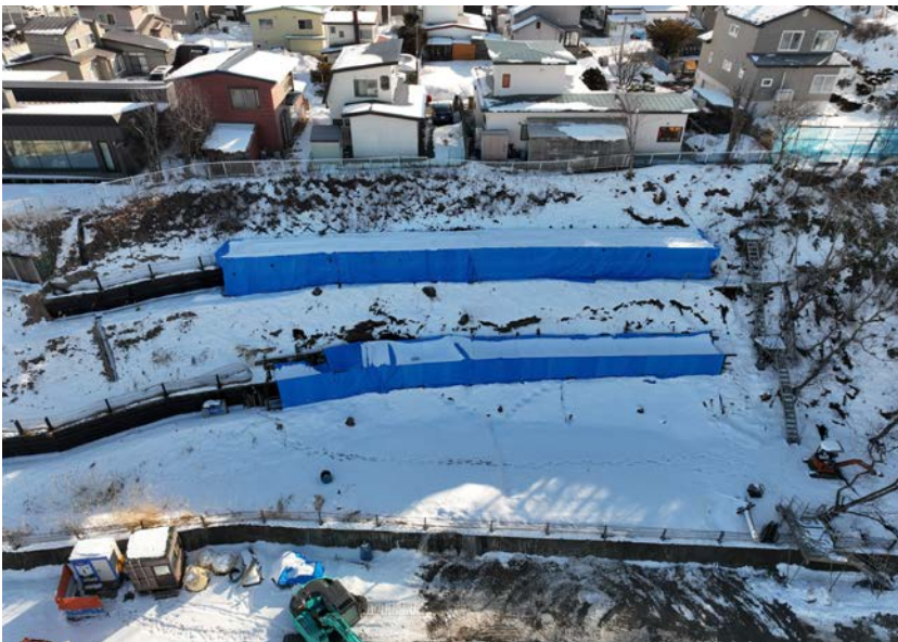
位置: 撮影日: 材木2工区 1月29日現在進捗状況