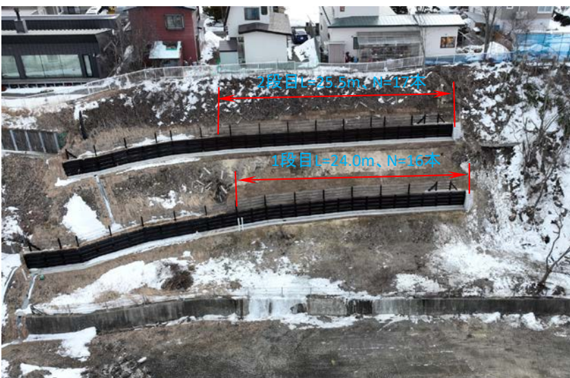
位置: 撮影日: 材木2工区 完成