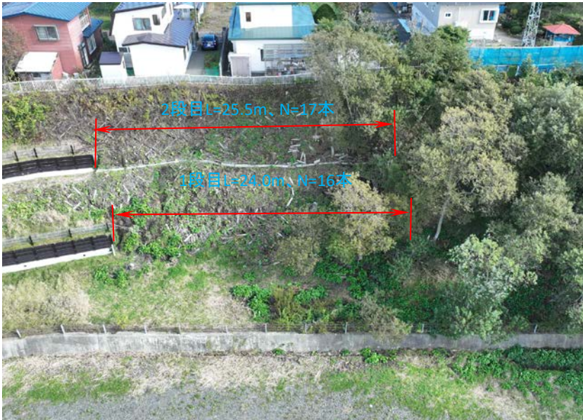
位置: 撮影日: 材木2工区 9月 着工前