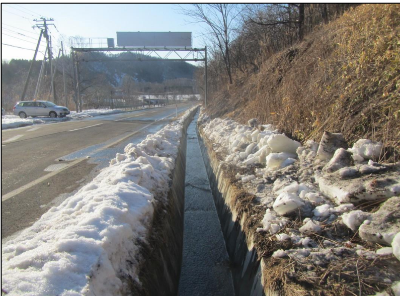
排水氷盤撤去状況