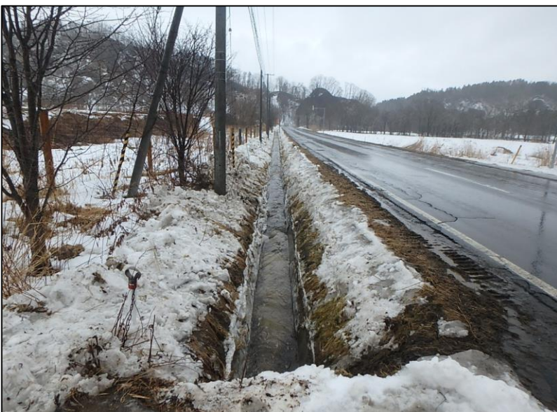
排水氷盤撤去状況